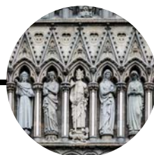
18 Octubre Trondheim