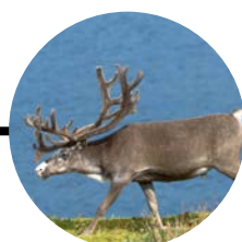
23 Octubre Hammerfest