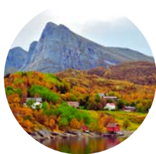
25 Octubre Rørvik