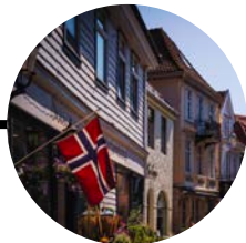
27 Octubre Bergen