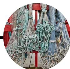
24 Octubre Islas Vesterålen y Lofoten