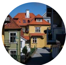
15 Octubre Bergen