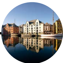
17 Octubre Ålesund