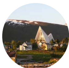
20 Octubre Tromsø