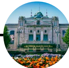
28 Octubre Bergen