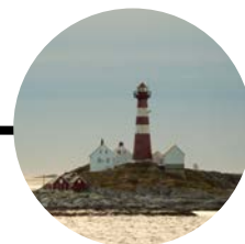
19 Octubre Círculo Polar