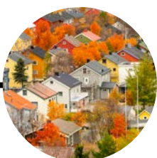
22 Octubre Kirkenes