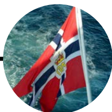
16 Octubre Bergen